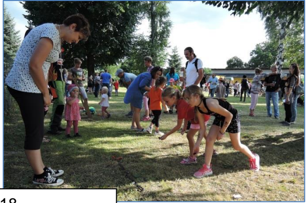
28. školní pouť 2018