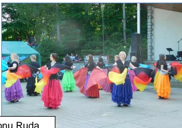
Den regionu Ruda 2018 Bušíně